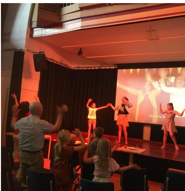
Samen zingen met gebaren.