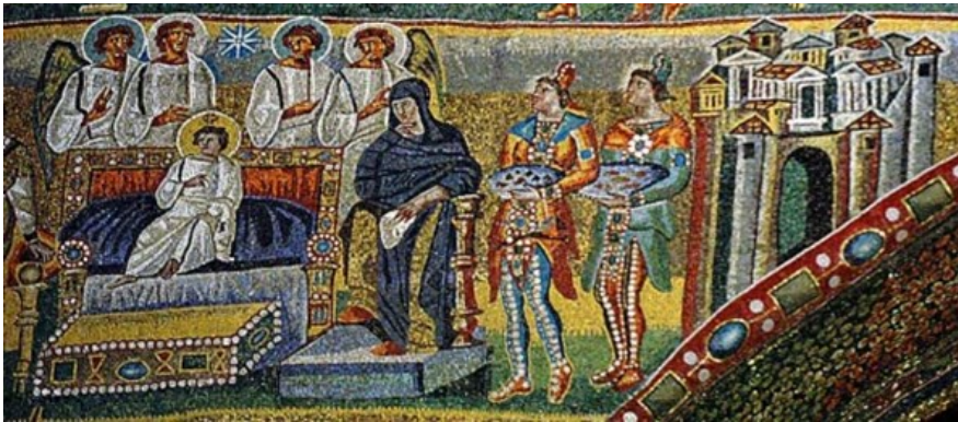
Deel van mozaïek uit Santa Maria Maggiore, Rome