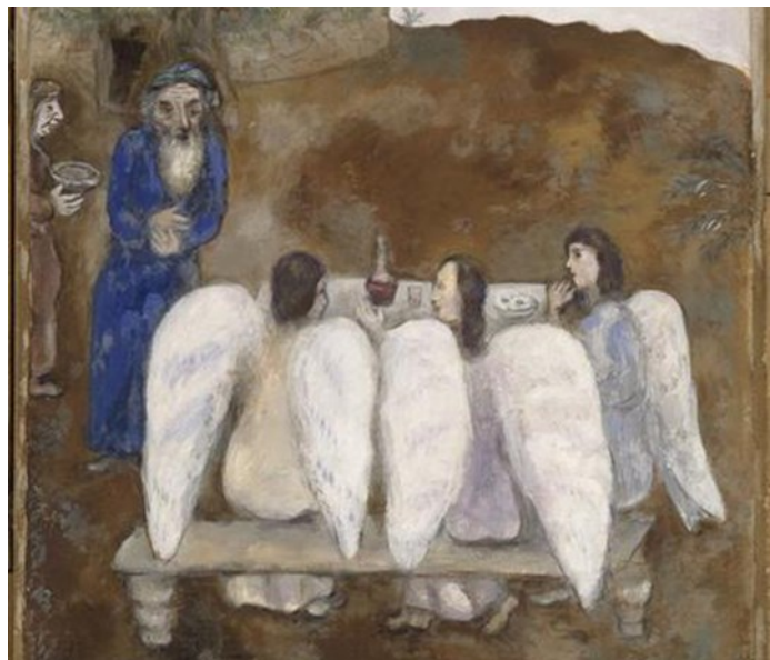
Engelen bij Abraham en Sara, Marc Chagall 1931