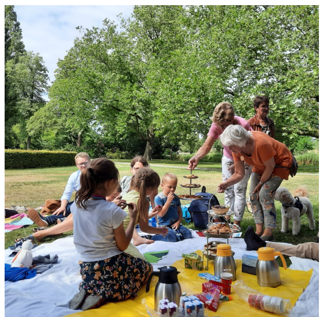
Samen eten na ontdekken en vieren in de natuur.